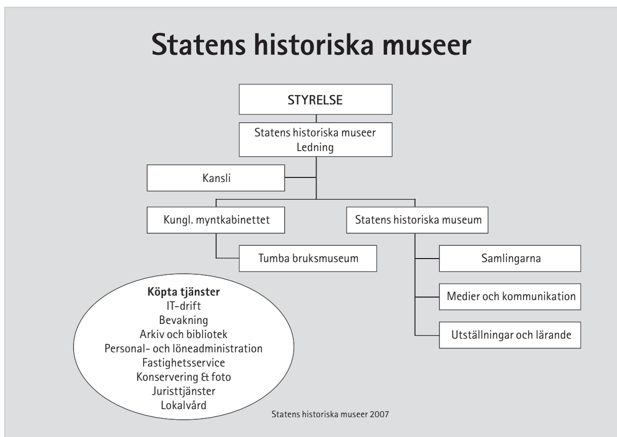
Figur 2. SHMM organisation 2007.

Inom ramen för den beslutade verksamhetsplanen med mål, uppgifter samt budget ansvarar SHM:s enheter för att genomföra verksamheten på bästa och effektivast möjliga sätt. Ytterligare underlag för verksamhetsplanen förvaras därför på enheterna. Verksamheten följs löpande upp av ledningen, bl.a. i samband med löpande enhetsvisa föredragningar. SHMM:s organisation år 2007 framgår av figur 2.